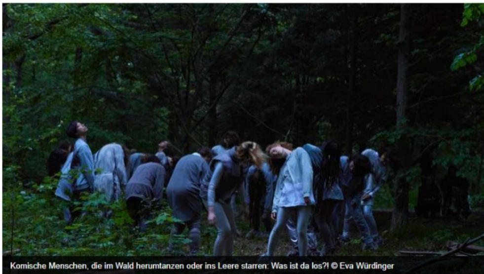
Komische Menschen, die im Wald herumtanzen oder ins Leere starren: Was ist da los?!